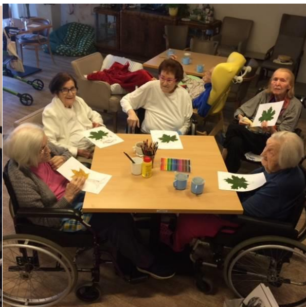
Pozdravy a tvoření od babiček