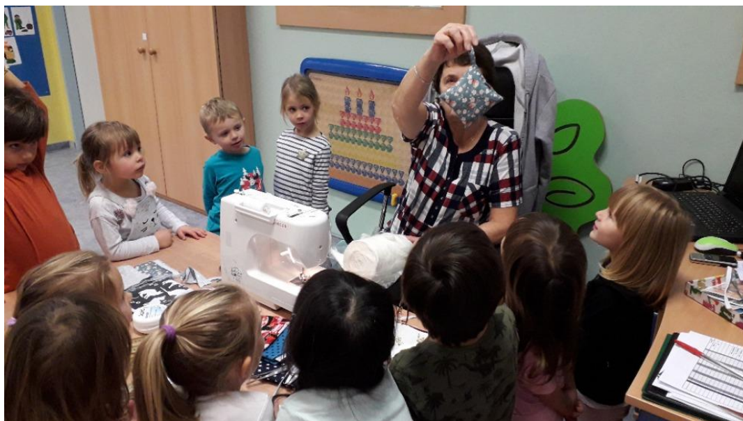
Ten je krásný 😊