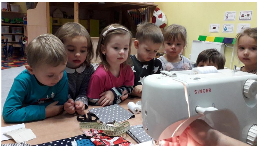
Šijeme jehelníčky pro babičky a dědečky

I v měsíci listopadu myslíme na naše babičky a dědečky . Na třídách vyrábíme drobné dárečky pro potěšení našich starších kamarádů .Ve školce jsme šili jehelníčky, kreslili obrázky, tvořili medailonky na vánoce a vyráběli ozdobičky. Babičky a dědečkové nám také zaslali překrásné pozdravy a výrobky ze kterých jsme měli velkou radost 😊